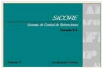
Diagrama de procedimiento y aspectos medulares del Régimen de retención del Impuesto a las Ganancias e IVA sobre los pagos que se efectúen a los sujetos adheridos al Régimen Simplificado para Pequeños Contribuyentes (Monotributo). Extensión como Agentes de Retención a todos los contribuyentes y su responsabilidad solidaria.

Verificación de tope máxima categoría o no adhesión/inscripción (suba topes Sept. 2013: $ 400.000 – servicios– y $ 600.000 –vta. bienes–) . Alícuotas y Códigos SICORE . Cuadro de sanciones con multa de hasta 10 veces lo no retenido ( Res. Gral. 2616/2009. AFIP y modif. )